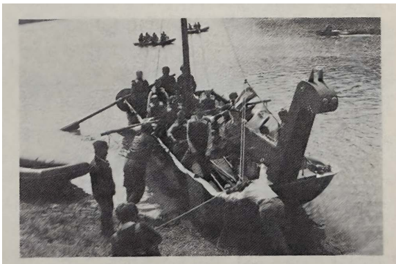
Der Ponton "Klevi" von der Jugendgruppe aus Kleve 1991 auf der Aggertalsperre